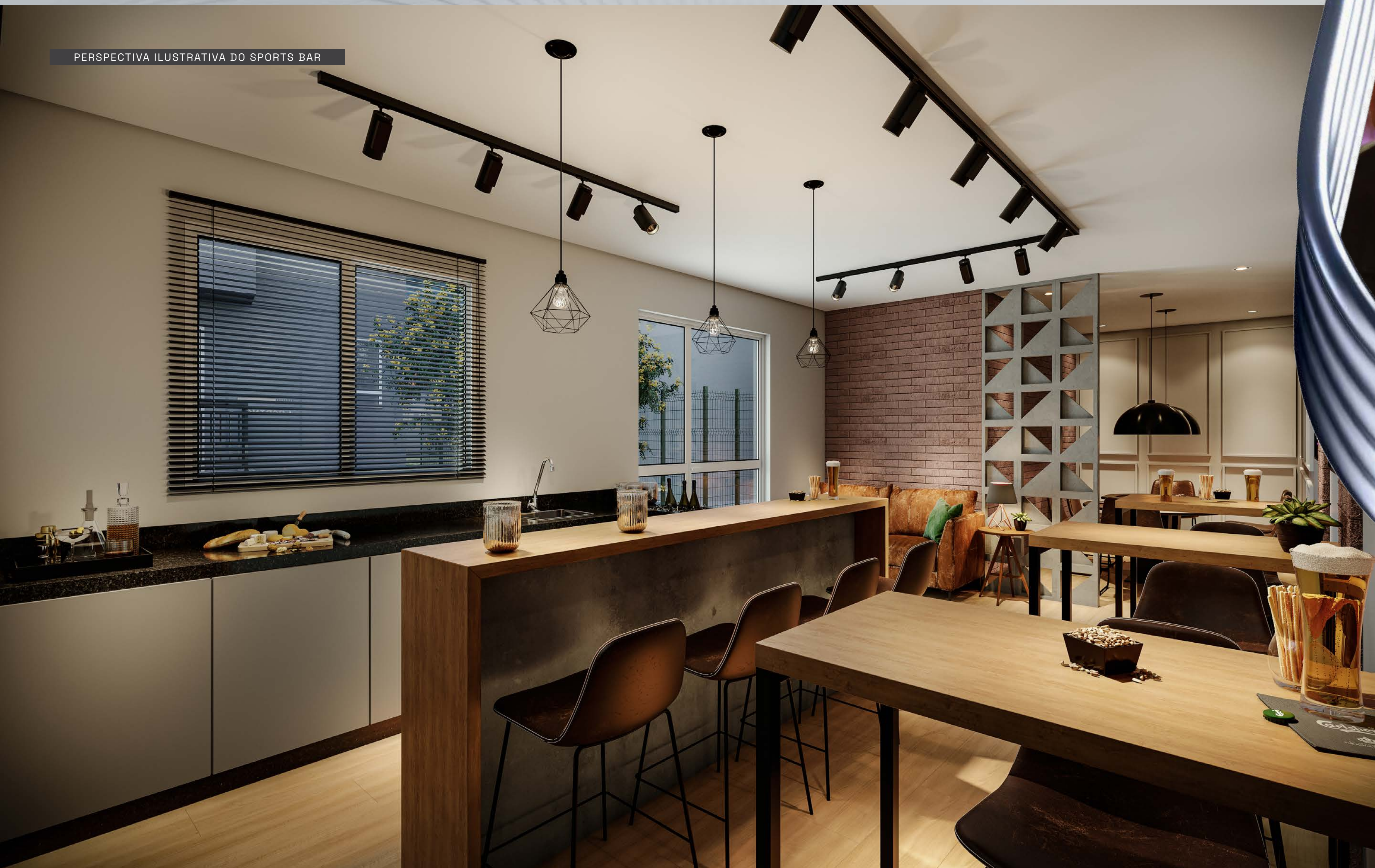
PERSPECTIVA ILUSTRATIVA DO SPORTS BAR